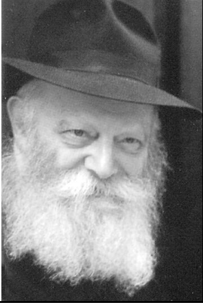
de las palabras del Rebe de Lubavitch