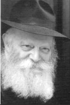
de las palabras del Rebe de Lubavitch

¿Qué Aprendemos esta Semana de la Parshá?