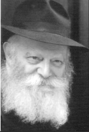
de las palabras del Rebe de Lubavitch

¿Qué Aprendemos esta Semana de la Parshá?